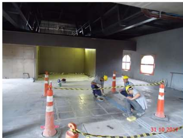
Execução do rejunte do piso de granito do mezanino.