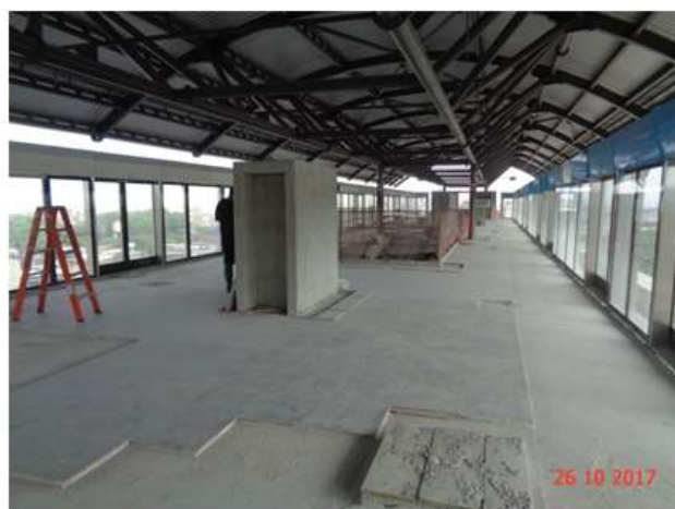
Execução do piso de granito da Plataforma.