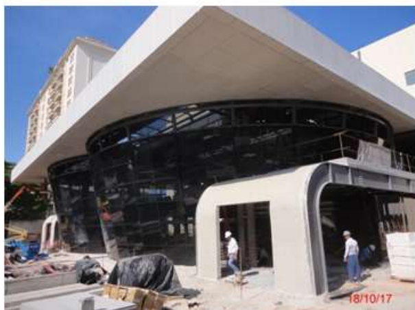
Acesso Sul: Conclusão da fachada