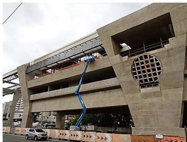
Instalação de estrutura metálica.