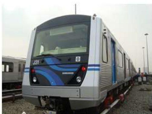
Linha 1 - Azul