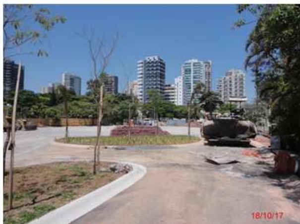
Parque das Bicicletas: Execução do paisagismo e pavimentação