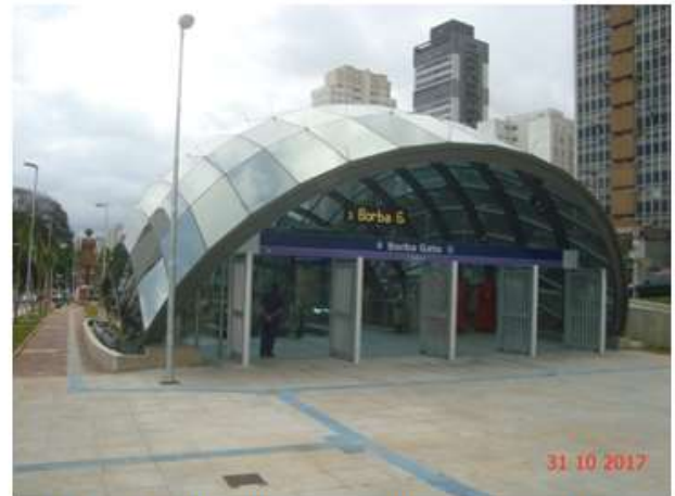
Acesso Principal Vista geral. Obra civil concluída