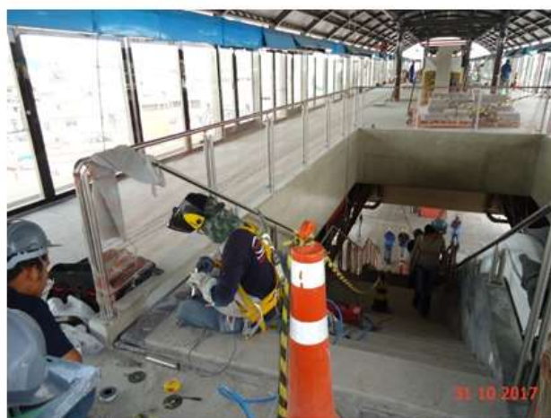
Instalação de corrimão da escada de acesso à plataforma.