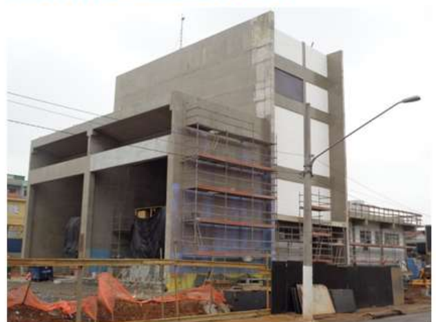
Execução do acabamento externo.