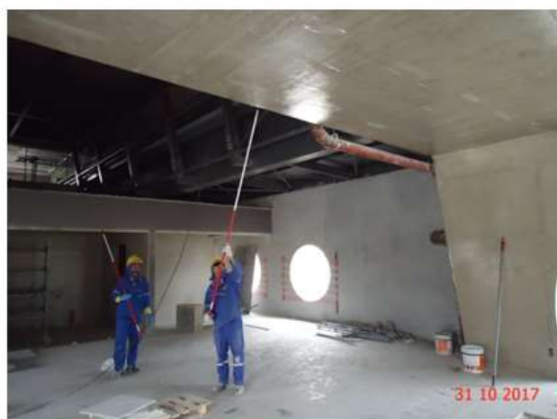
Aplicação de verniz na região do mezanino.