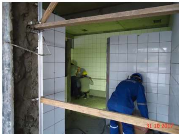
Instalação de contramarcos e bancadas dos sanitários.