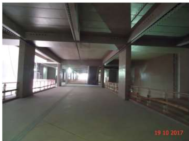
Mezanino Inferior: Montagem do forro.