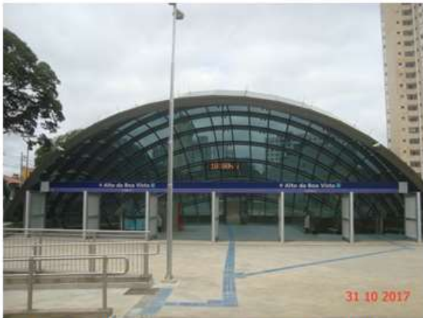
Acesso Principal: Vista geral. Obra civil concluída