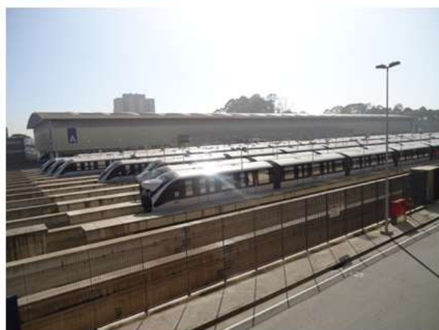
Trens em testes no Pátio Oratório.