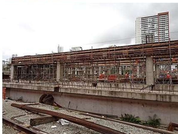
Execução de pilares e vigas do bloco A (Oficina).