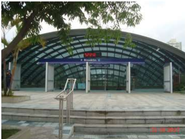
Acesso Principal: Vista geral. Obra civil concluída