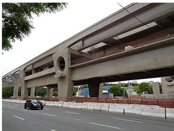
Vista do corpo da Estação.