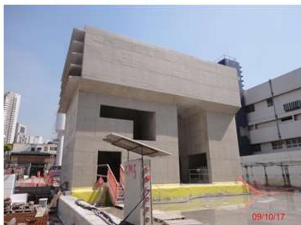
Torre de ventilação / saída de emergência: Acabamento do concreto