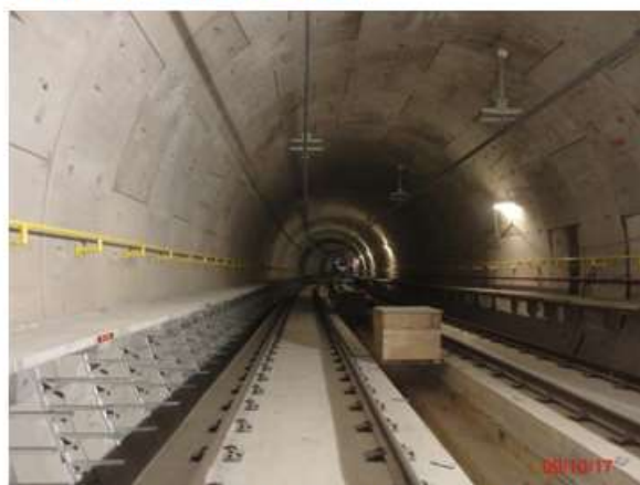
Trecho Hospital São Paulo – AACD: Instalação do bandejamento