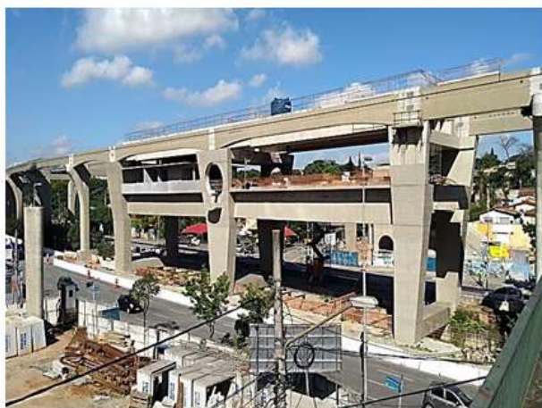
Corpo da Estação.