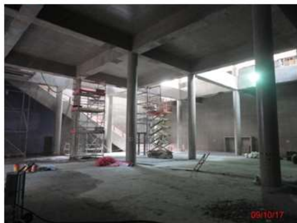
Mezanino superior: Acabamento