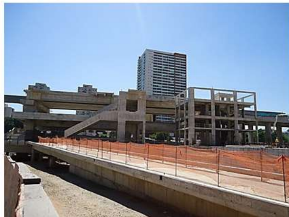
Corpo da Estação.