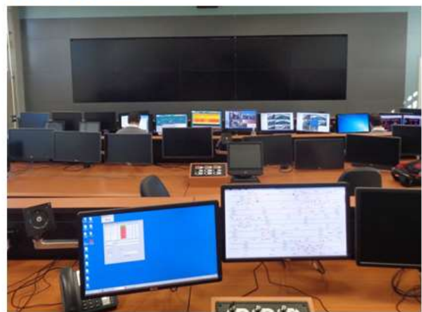
Bloco B: vista do CCO.