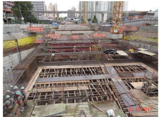
Corpo da estação – Poço 5: Laje do nível Cobertura