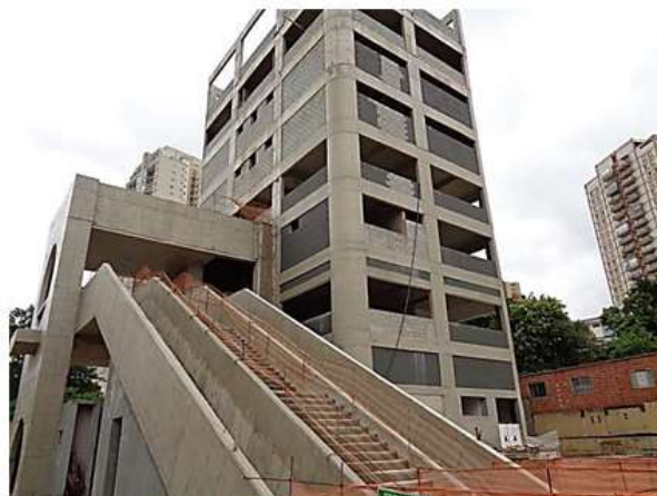
Acesso e Edifício Operacional.