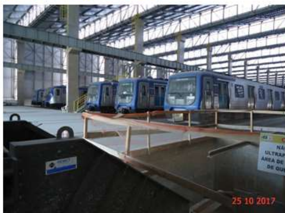
Trens da frota P e F estacionados no Bloco A do Pátio Guido Caloi.