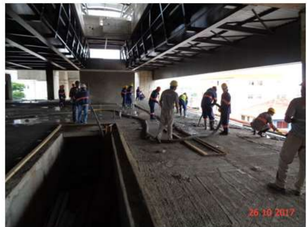
Execução do contrapiso do Mezanino.