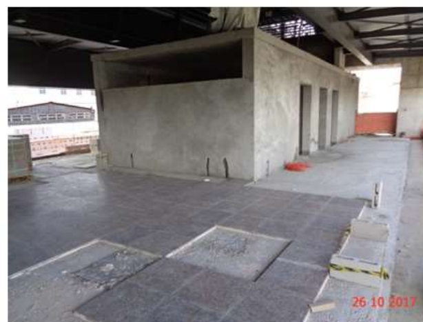
Execução do piso de granito do Mezanino.