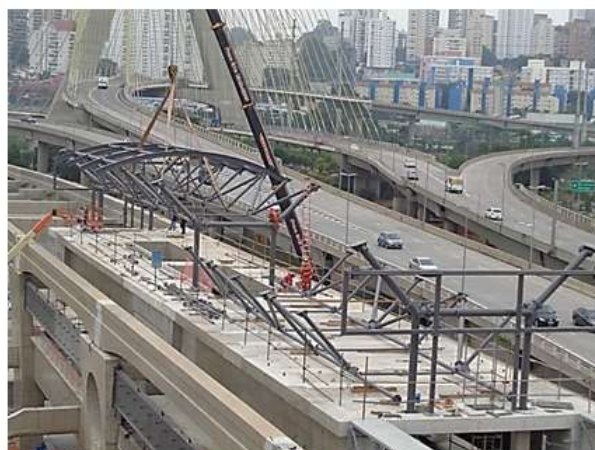
Instalação da cobertura metálica da Estação