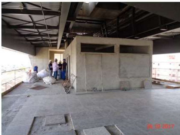
Execução do piso de granito do Mezanino.