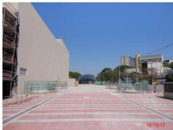
Edifício das salas técnicas: Vista externa