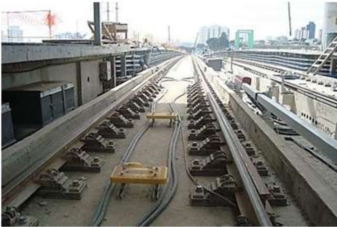
Equipamentos na via