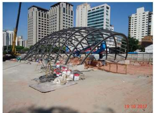
Acesso Principal: Montagem da estrutura metálica da cobertura.