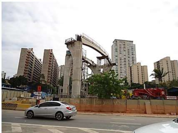
Lançamento de vigas guia curvas.