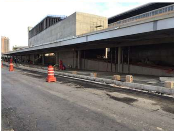
Execução das guias, sarjeta e acabamento do Terminal